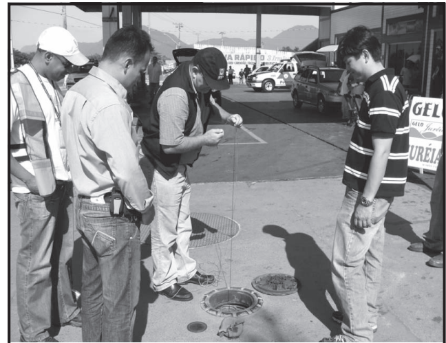
O Posto Oasis, na Av. Luciano de Bona, apresentou irregularidades e foi interditado pela Defesa Social

O posto de combustível Via Brasil não apresentou irregularidades, já o posto Oásis foi interditado devido à perda da Inscrição Estadual. Além disso, o posto apresentou outros problemas como restos de gasolina contaminada em dois tanques, que segundo os