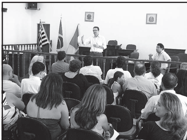
A apresentação no plenário da Câmara Municipal